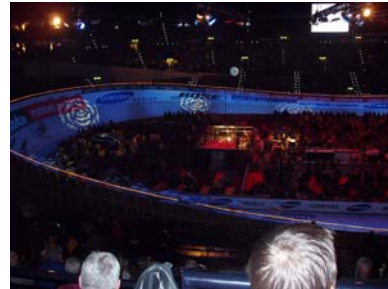
Das Rund von Oben...