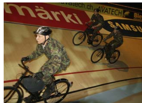
Die Radfahrer schenken sich nichts...

Doch für die Waffenläufer stand der eigentliche Höhepunkt des Abends erst noch bevor: Die Militärradfahrer. Dieser Sideevent, angeführt vom mehrfachen